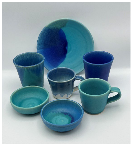
「舞洲焼」の陶器でティータイム