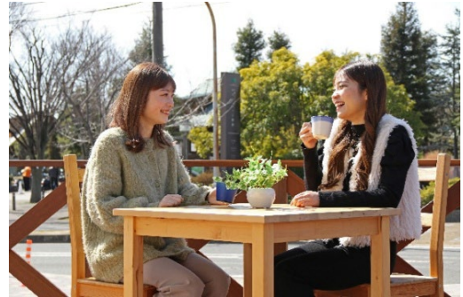
潮風が気持ちいいテラス席20席